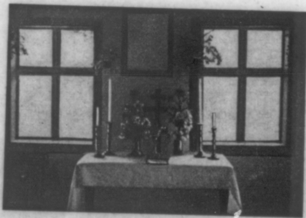
Altartisch in einem für Gottesdienste benutzten Bauernhause in Bacylow (Ukraine)