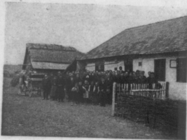
Gottesdienst in einem Bauernhause in Bacylow (Ukraine)

Und dies um so mehr, als ich so die beste Gelegenheit hatte, die Vorwürfe, die ich in Warschau und Koloméa seitens der Reformierten gegen die Lutheraner gehört hatte, auf ihre Zuständigkeit zu prüfen: der lutherische Gottesdienst sei stark katholisch, Heiligenbilder würden verehrt und geföhrt, eine Art Messeabendmahl gefeiert u. a. Natürlich schaute ich mir darauf (in gleich den Raum an, in dem der Gottesdienst stattfinden sollte. Es war das große Zimmer eines typischen Bauernhauses, etwa 5:5 m Fläche. An der Wand, zwischen den Fenstern, stand ein einfacher Tisch mit griechischem Kreuz, je zwei selbst gedrehte Holzleuchter, ukrainische Papierblumen und eine Bibel darauf. Neben diese stellte Br. J. , nachdem er coram publico sich den