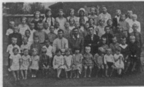
Eine Sonntagsschule rußlanddeutscher Flüchtlingskinder in Harbin (China)